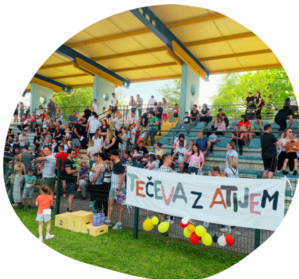
Dogodek "Tečeva z atijem" (maj 2023)