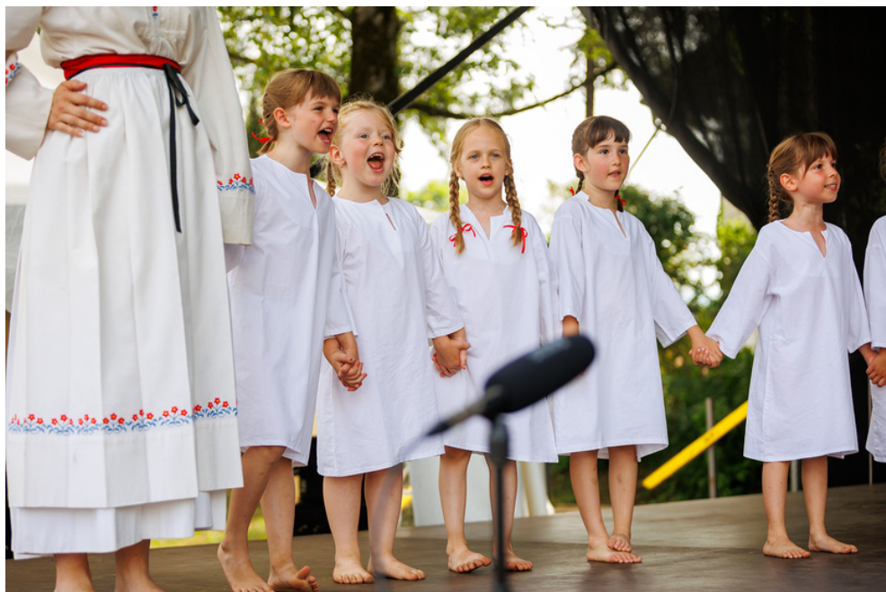
Srećanje "Pastirče mlado" (junij 2023)