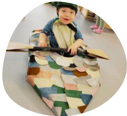
Nagrajeni izdelek natečaja UHU (junij 2023)