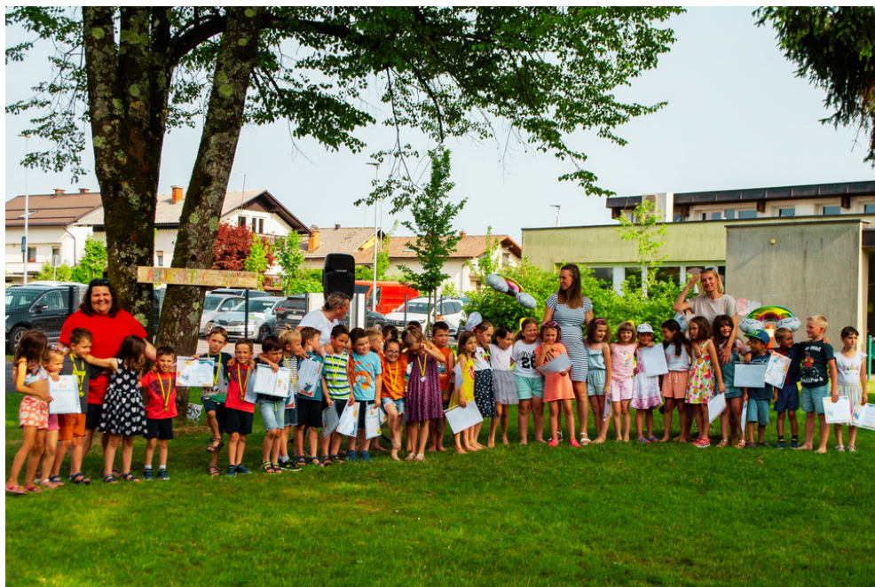
Slovo od vrtca (junij 2023)